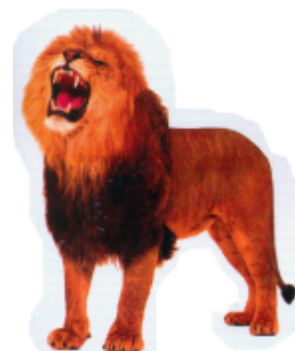
ଛେଲ (ଟାକ) ସିଂହ (Lion)