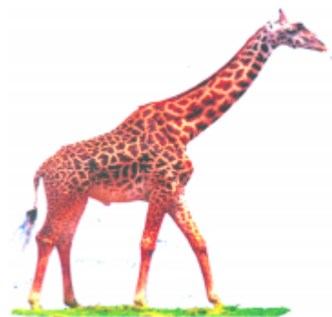
ଝିରାଫ (ଜିରାଫ) ଜିରାଫ (Giraffe)