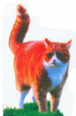
ଓଢ଼େଇ (ବିଲେଇ) ବିଛା (Cat)