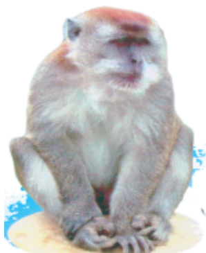
ଠଢ଼େଠଠ (ବାନ୍ଦର) ବାନ୍ଦର (Monkey)