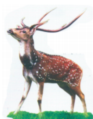
ଝଢ଼େଇ (ଚୋଢ଼ୋରା) ଚିତ୍ରା ହରିଣ (Spotted deer)