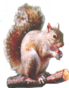
চোগোদা (চোগোদা) কাঠবিড়ালী (Squirrel)