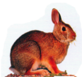
ꠘꠟꠟꠟ (হরগচ) খরগোশ (Rabbit)