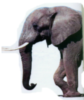
ꠘꠟꠟꠟ (এইত) হাতি (Elephant)