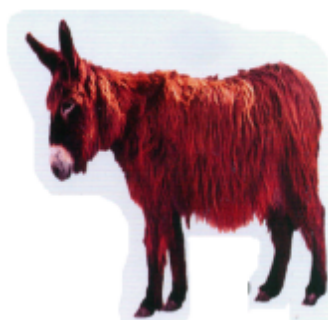
ꠘꠘ (গাদা) গাধা (Donkey)