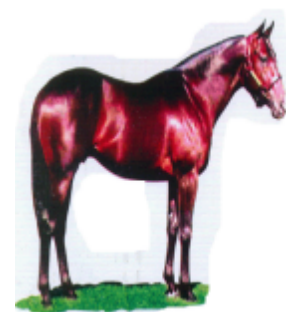
ꠘꠟꠟꠟ (ঘোরা) ঘোড়া (Horse)