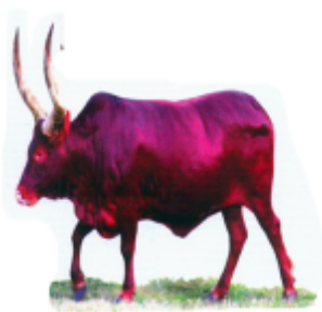
ଝେଲା ଗୁରା (ছেলা গুরা) ষাঁড় (Ox)