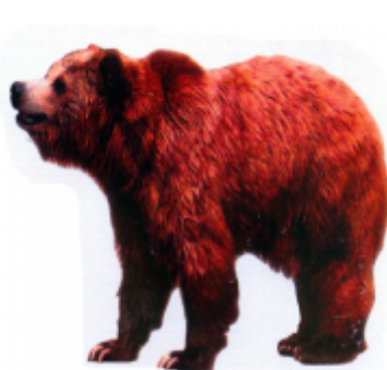
ଝଢ଼େଲେ (ଭାଲୁକ) ଭାଲୁକ (Bear)