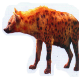
ꠘꠟꠟꠟ (পেবো) হায়না (Hyena)