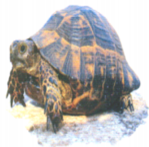
দুর (দুর) কচ্ছপ (Tortoise)