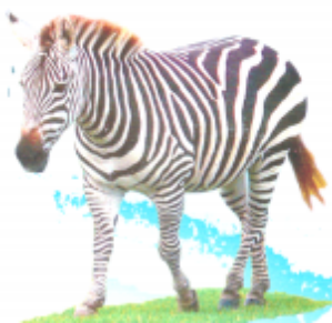
ଝେଠଠ (ସେପରା) ଜେବରା (Zebra)