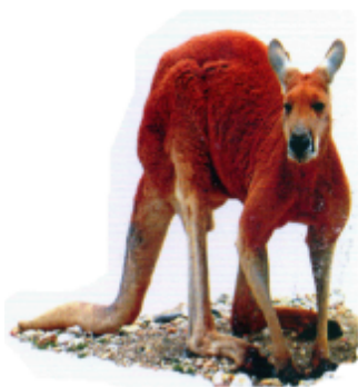
କ୍ୟାଙ୍ଗାରୁ (ହେଙ୍ଗାରୁ) କ୍ୟାଙ୍ଗାରୁ (Kangaroo)