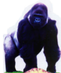
ꠘꠟꠟꠟ (জার মানুচ) গরিলা (Gorilla)