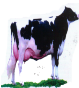
ଓଢ଼େଇ (ପାରିଶ୍ରମ) ଗାଞ୍ଜୀ (Cow)