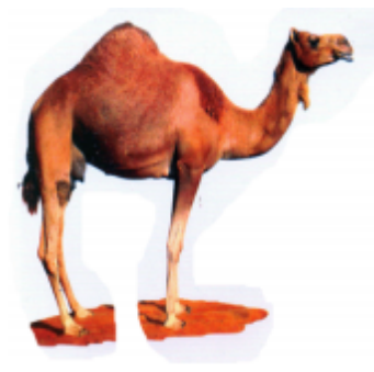
ଓଠ (ଉତ) ଉଟ (Camel)