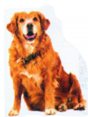
ଓଢ଼େଇ (ହଞ୍ଜର) କୁକୁର (Dog)