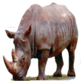
ଗନদାର (গনদার) গভার (Rhinoceros)