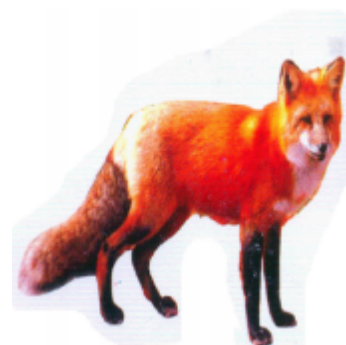
ꠘꠟꠟꠟ (সিয়েল) শিয়াল (Fox)