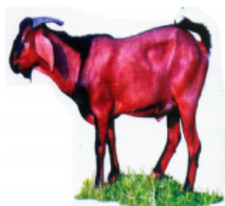
ꠘꠟꠟꠟ (সাগল) ছাগল (Goat)