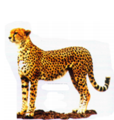
ଓଢ଼େଇ ଗଞ୍ଜ (ହିଦିରେ ବାକ) ଚିତ୍ରାବାଘ (Cheetah)