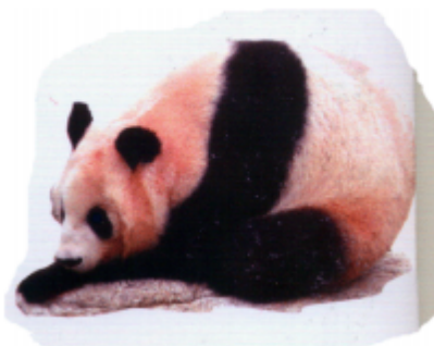
ପାନଦା (পানদা) পান্ডা (Panda)