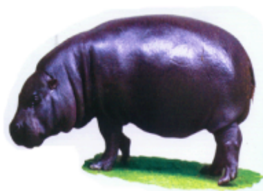
ꠘꠟꠟꠟ (জলহচতি) জলহস্তী (Hippopotamus)