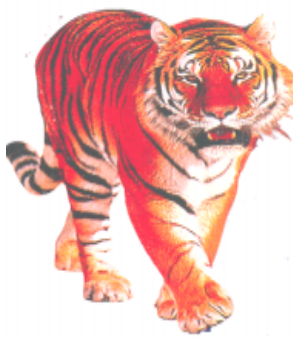
বাক (বাক) বাঘ (Tiger)