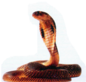
সাপ (সাপ) সাপ (Snake)