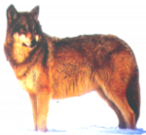
ଠୁଘେଲ (ଓୟାକ) ନେକଡ଼େ (Wolf)