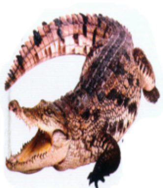
କଢ଼େଇ (କୁମୋର) କୁମିର (Crocodile)