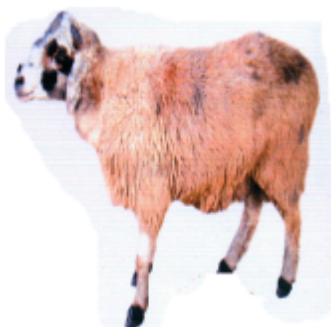
ভেড়া (ভেড়া) ভেড়া (Sheep)