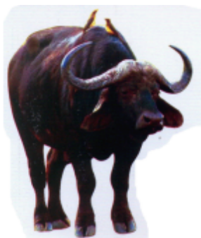
ଡ଼େଞ୍ଚ (ମୋଚ) ମହିଷ (Buffalo)