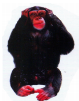
ଠଠଠଠଠଠଠଠ (ଅଳାବାନ୍ଦର) ଶିମ୍ପାଞ୍ଜି (Shimpanzee)