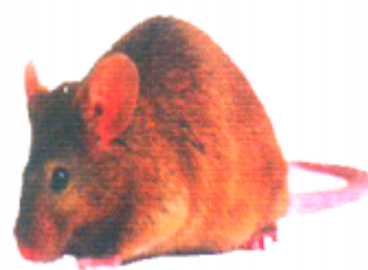
উনদুর (উনদুর) ইঁদুর (Rat)