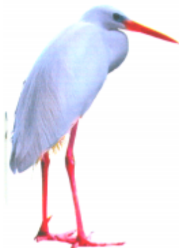
ꠞꠞ ꠞꠞ (দুপ বোগা) বক (Heron)