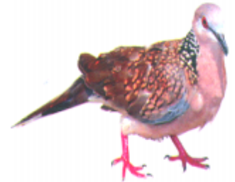
ଠଠ (ହଅ) ଘୁଘୁ (Dove)