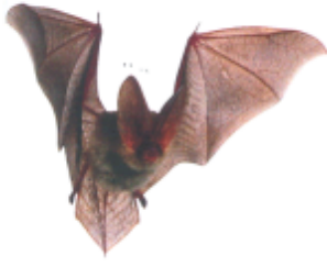
ଓଡ଼ୁଲ (ବାଦୋଳ) ବାঁଦୁଡ଼ (Bat)