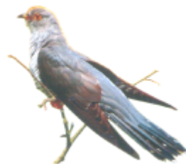
ꠞꠞꠞꠞ (কোগিল) কোকিল (Cuckoo)