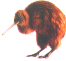
কিউই (কিউই) কিউই (Kiwi)