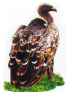
ယုပွင် (ယုပွင်) ဟေဝ် (Vulture)