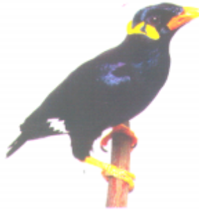
ଓଓଓଓ (ସେହିର) ମୟନା ପାখି (Mynah)