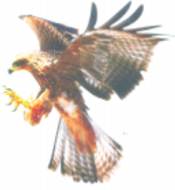
খীল (চিল) চিল (Kite)