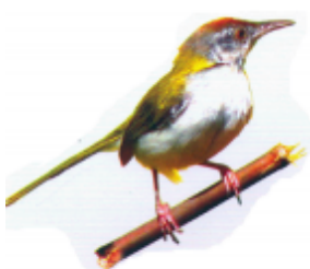
ယုပွင် နေ် (ယုပွင် နေ်) ဟေဝ် (Tailor bird)