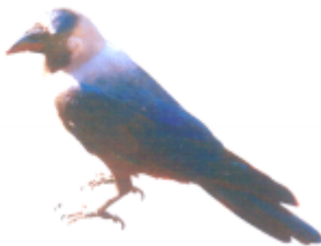
ꠞꠞ (কবা) কাক (Crow)