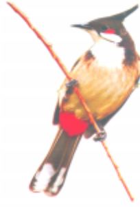
ଓଡ଼ିଠୁ ଡେଲ (ଝୁରଗୋ ପେକ) ବୁଲବୁଲି (Bulbul)