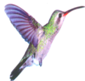
ꠞꠞ ꠞꠞꠞꠞ (ফুল চুজোনি) মৌটুসি (Hummingbird)