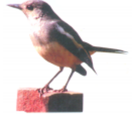
ঢ়ল খুঁচুই (গুল চোদোরি) দোয়েল (Magpie)