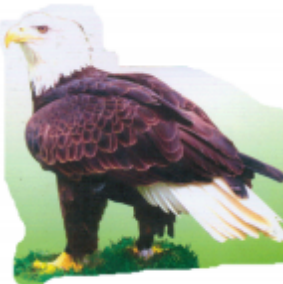
ꠞꠞꠞꠞ (ইগল) ঈগল (Eagle)