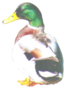
ꠞꠞꠞ ꠞꠞꠞ (আজা আচ) পাতি হাঁস (Duck)