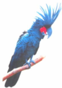
ꠘꠞꠞ, ꠘꠞ (জুত্বে রাদা) কাকাতুয়া (Cockatoo)