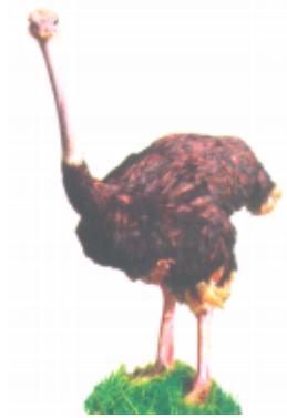
ঢ়ল ঢ়ল (উত পাগি) উট পাখি (Ostrich)