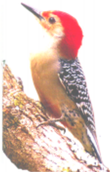
ଠଠୁଲେ (ହରୋଲ୍ୟେ) କାଠ ଠୋକରା (Woodpecker)