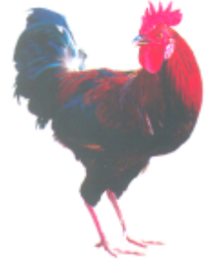
ଓଠ ଡ଼ଠ (ରାଦା ପୁରୋ) ମୋରଗ (Cock)