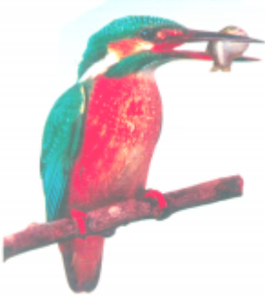
ଓଓଓ (ମାରାଞ୍ଜ) ମାଛରାଜା (Kingfisher)