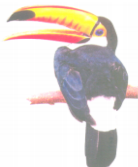
ꠞꠞ ꠞꠞ (রং রাং) ধনেশ (Hornbill)