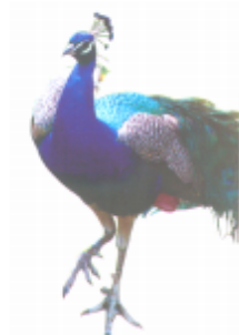
ঢ়ল (মোয়ুর) ময়ুর (Peacock)