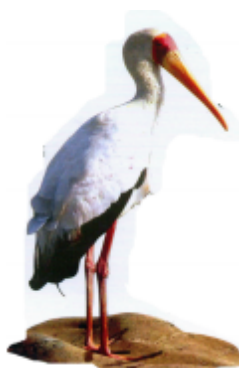
လေဝ် နေ် ဟွင် (လေဝ် နေ် ဟွင်) ဟေဝ် ပေင် (Stork)