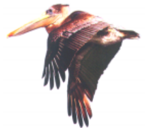
ঢ়ল ঢ়ল (পানি পৰি) পান কৌড়ি (Pelican)