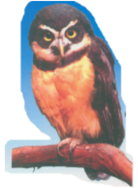
ঢ়ল (পেজা) পেঁচা (Owl)