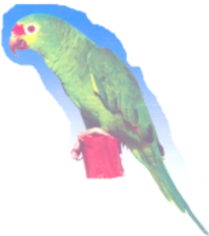
ঢ়ল (টদেক) ঢ়িয়া পাখি (Parrot)