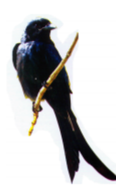
ဟေဝ် (ဟေဝ်) ဟေဝ် (Swallow)