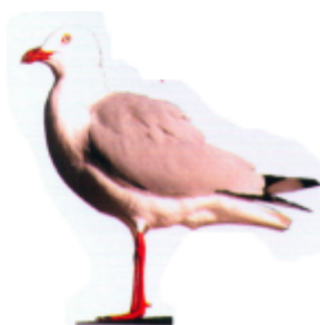
ဂေင်္ဂေင် (ဂေင်္ဂေင်) ဂေင်္ဂေင် (Seagull)