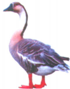
ଠଠ ଠଠ (ରାଚ ଆଚ) ରାଜ ହାସ (Swan)