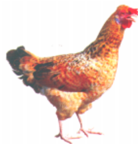
ꠞꠞꠞ ꠞꠞꠞ (হরি পুরো) মুরগি (Hen)