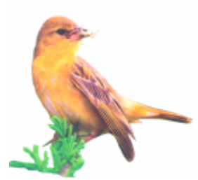
ଓଓ (ପେରା) ବାବୁଇ ପାখି (Weaver)