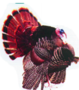
ဟေဝ် နေ် (ဟေဝ် နေ်) ဟေဝ် (Turkey)